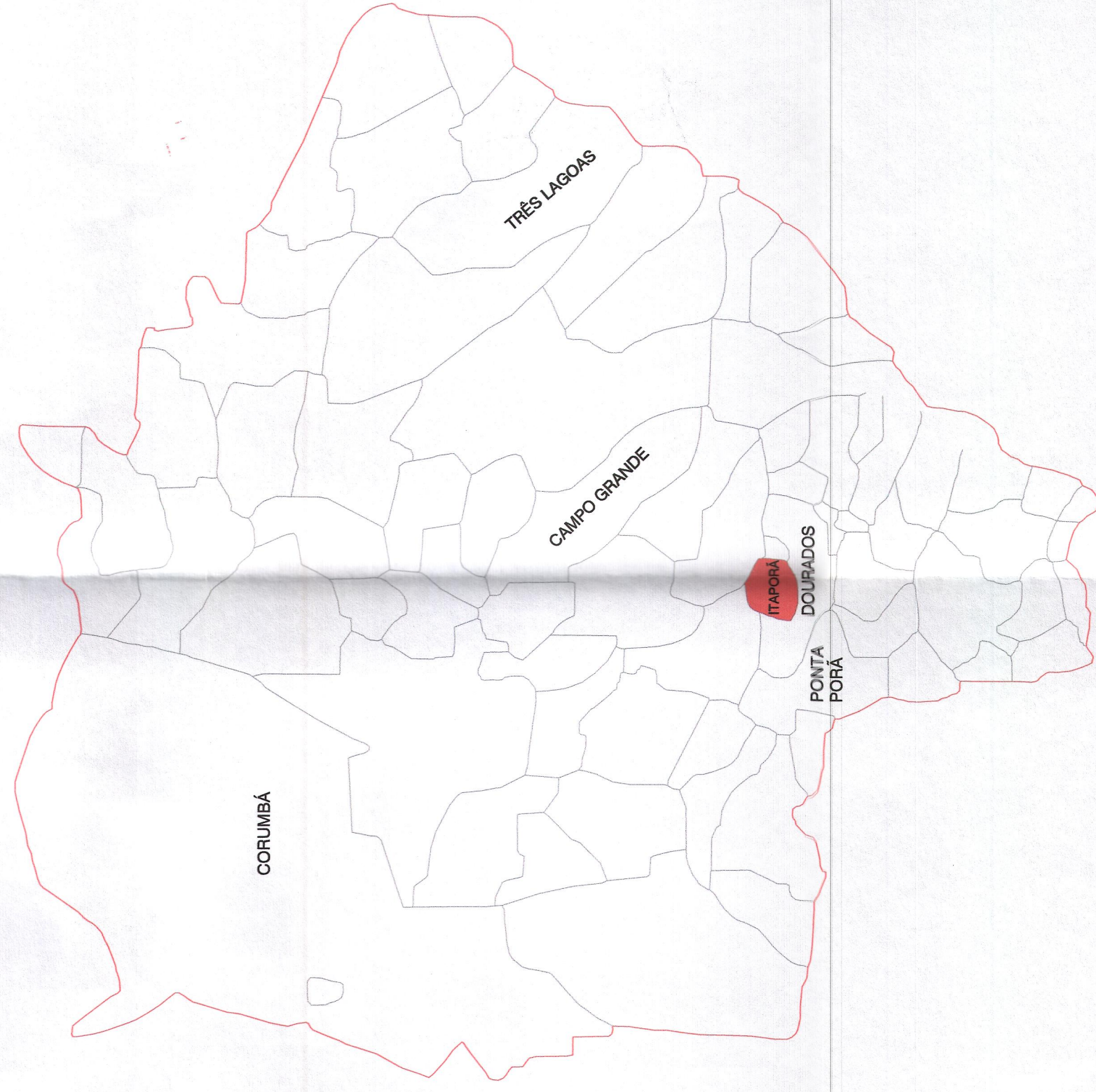
LOCALIZAÇÃO DO MUNICÍPIO NO ESTADO